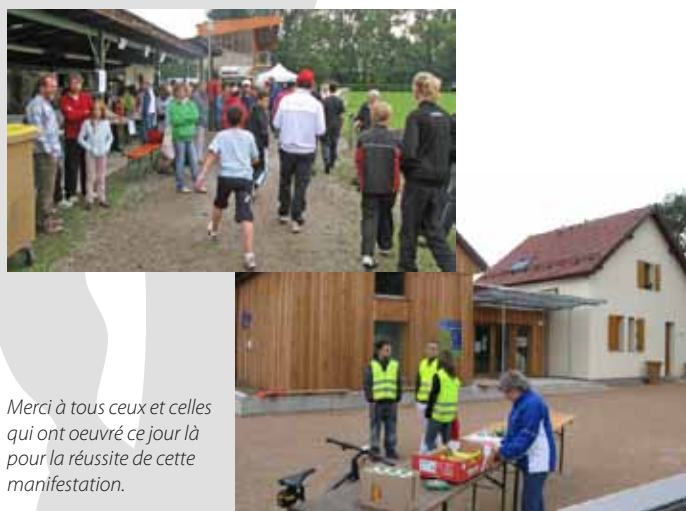
Merci à tous ceux et celles qui ont œuvré ce jour là pour la réussite de cette manifestation.