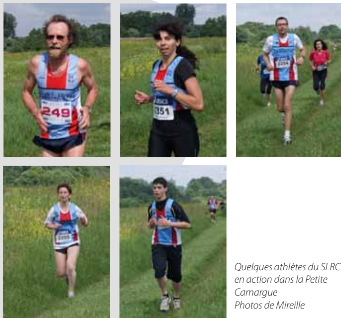
Quelques athlètes du SLRC en action dans la Petite Camargue

L'édition 2011 aura lieu le 18 juin 2011. Nous espérons que vous serez plus nombreux à donner un coup de main pour l'organisation.