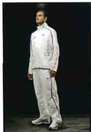
UNE ÉTOILE EST NÉE Mehdi Baala est très populaire dans les médias et c'est une des stars de l'athlétisme français.