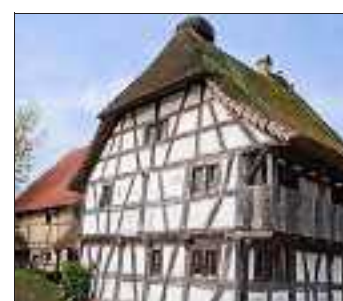
La maison Frisch de Hégenheim à l'Écomusée.