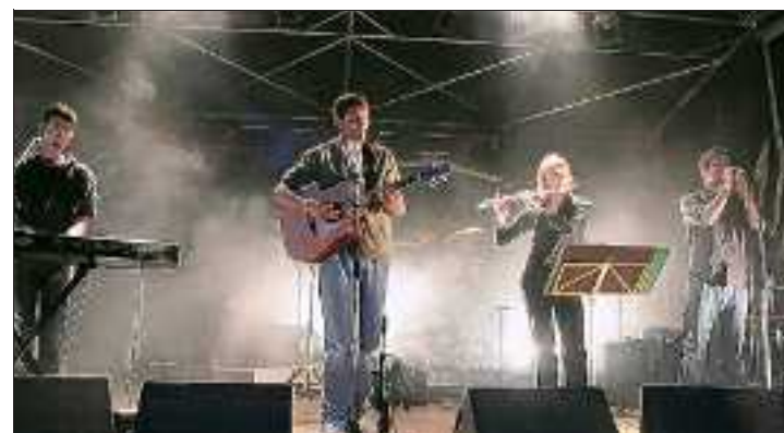
Les Malbarés joueront samedi soir à l'invitation de la Musique Union de Hégenheim qui, dans sa tente, servira un repas asiatique.

● Renseignements : infos@sl-running.org ou par Tél. au 03.89.70.74.10 ou au 03.89.67.48.81.