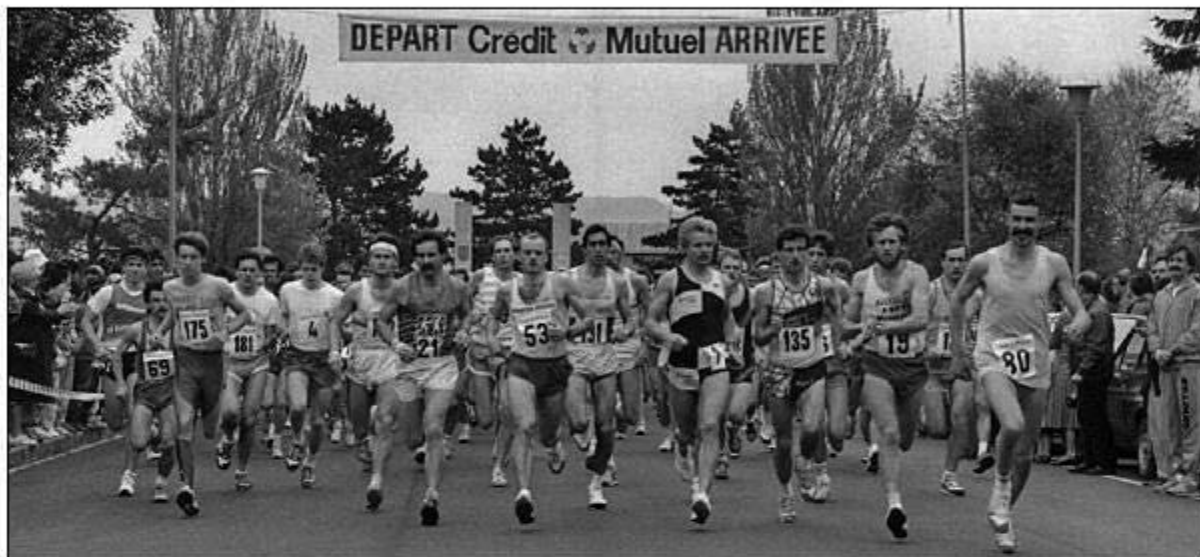
Départ des 20 km de Saint-Louis en 1989.

De nombreuses épreuves sportives ont été organisées : la corrida de Saint-Nicolas animant durant douze ans le centre-ville de Saint-Louis, les 20 km, le semi, les foulées, mais aussi les triathlons, vétoathlons et duathlons qui ont fait courir nombre d'athlètes convaincus. Au fil des années, d'autres grands rendez-vous ont pris le relais, notamment la course des 3 pays, les courses de la Petite Camargue alsacienne ainsi que celle des Kaesnappers à Hégenheim. Et, saison après saison, les performances se sont multipliées et des athlètes d'exception ont marqué l'histoire du club, à