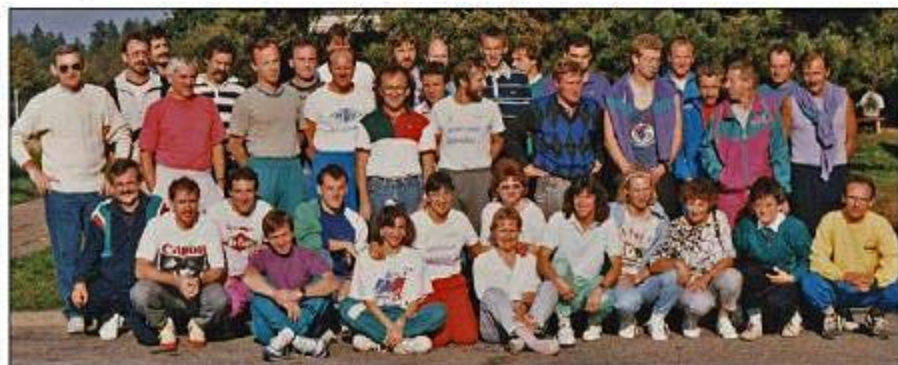
Le Saint-Louis Running club à la course Morat-Fribourg en 1989.